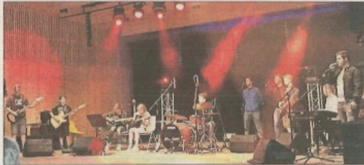
Das Sommer-Open-Air des Vereins GuitArt mit einer aufwändigen Lichtshow in St. Martin sorgte für Begeisterung.